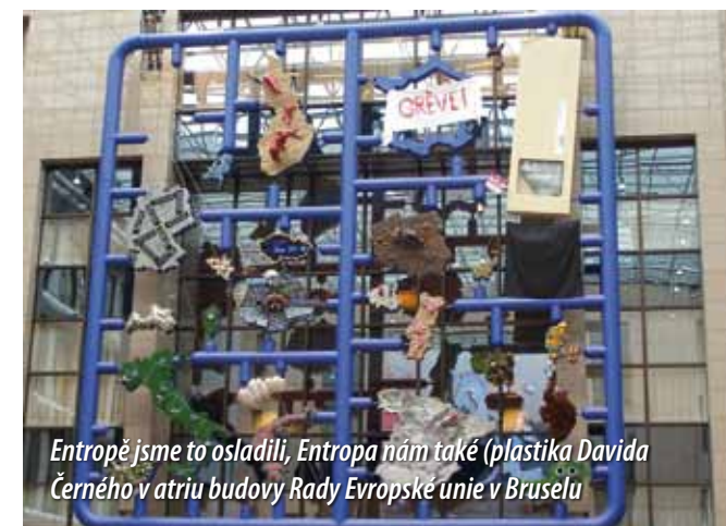
Entropě jsme to osladili, Entropa nám také (plastika Davida Černého v atriu budovy Rady Evropské unie v Bruselu)

Jednou z našich priorit bylo téma „Migrace, integrace a drogy“. Tenhle problém je důležitý nejen pro Českou republiku, ale i pro jiné země EU, které vnímají určité skupiny migrantů i vlastních minorit jako vysoce rizikové ve vztahu k drogám a krví přenosným infekcím (HIV/AIDS a žloutenky). U nás jde zejména o tzv. „ruskojazyčné migranty“ (z bývalých zemí Sovětského svazu) a o část domácí romské populace, v Portugalsku o migraci ze Západní Afriky a v jiných zemích zas o jiná etnika, všude však tyto skupiny představují takřka časovanou bombu a hrozbu pro veřejné zdraví i bezpečnost. Jak této hrozbě čelit? Jak přitáhnout rizikové skupiny do programů odborné pomoci a léčby? Jak – v případě migrantů – pomoci řešit drogové problémy v zemích jejich původu, aby se nepřenášely na území EU? O tom se debatovalo dosti bouřlivě, protože pro některé země EU je samo pojmenování tohoto problému politicky nepřijatelné, diskriminující a stigmatizující. Ukázalo se, že společné stanovisko EU je v současnosti nedosažitelné; členské země EU teprve hledají společný jazyk, jak o tom „politicky korektně“ komunikovat. Ale shodli jsme se, že výzkum, sdílení zkušeností a opatření na národní úrovni musí pokračovat.