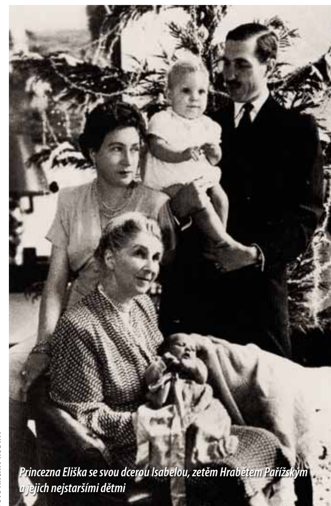
Princezna Eliška se svou dcerou Isabelou, zetěm Hrabětem Pařížským a jejich nejstaršími dětmi