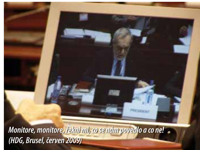
Monitore, monitore, řekni mi, co se nám povedlo a co ne! (HDG, Brusel, červen 2009)

Málo si uvědomujeme, jak katastrofální byla situace ve vyspělých evropských zemích v době, kdy nás od nich dělila „železná opona.“ 70. a 80. léta minulého století byla ve znamení rozmachu černého trhu s drogami a drogové epidemie mezi obyvateli, doprovázené epidemií HIV/AIDS. Tehdejší Evropské společenství (později Evropská unie) nakonec nastolilo společnou strategii. Jejím jádrem je tzv. vyvážený přístup, který se věnuje nejen represí a „boji proti drogám“, ale i prevenci, léčbě, sociální rehabilitaci závislých a zaměřuje se i na omezení rizik šíření HIV/AIDS. Protože se ukázalo, že