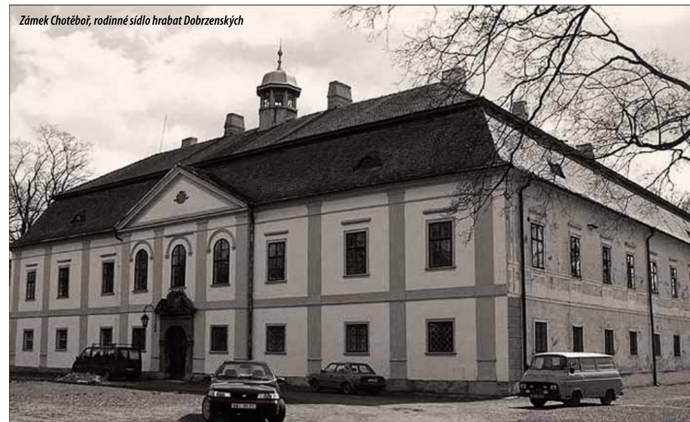
Zámek Chotěboř, rodinné sídlo hrabat Dobrzenských