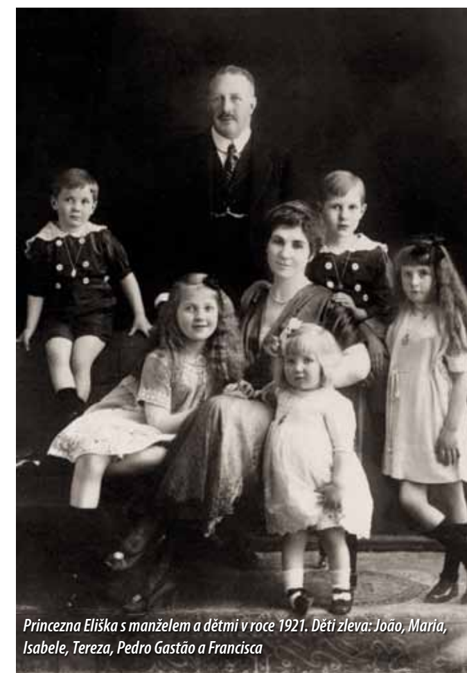
Princezna Eliška s manželem a dětmi v roce 1921. Děti zleva: João, Maria, Isabele, Tereza, Pedro Gastão a Francisca