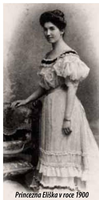
Princezna Eliška v roce 1900