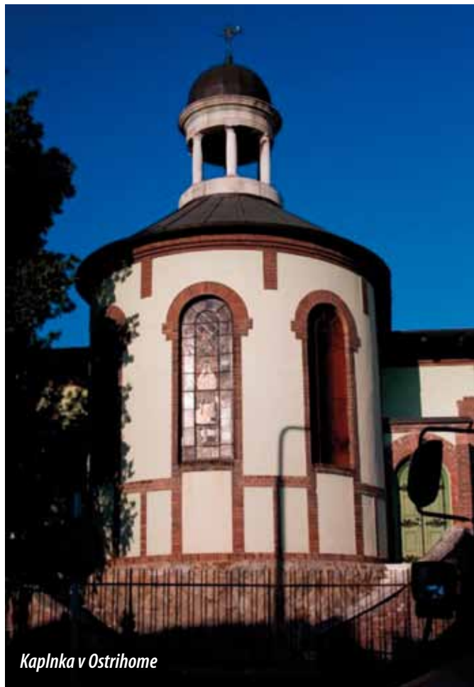
Kaplnka v Ostrihome