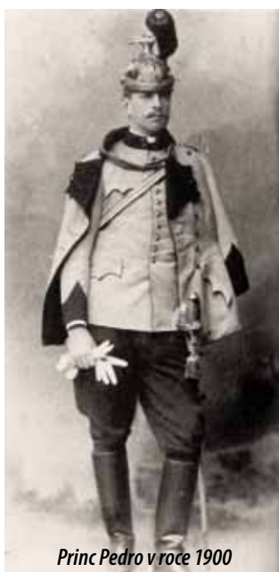
Princ Pedro v roce 1900

Až do své smrti zůstala Eliška věrná svému českému původu. V roce 1939 vymohla u brazilské vlády, aby československé vyslanectví nemuselo být předáno Němcům. Za druhé světové války vykonávala Eliška funkci čestné předsedkyně československého pomocného výboru při brazilském Červeném kříži, který poskytoval vydatnou pomoc Československému červenému kříži v Londýně. Zemřela ve věku 75 let v portugalské Sintře.