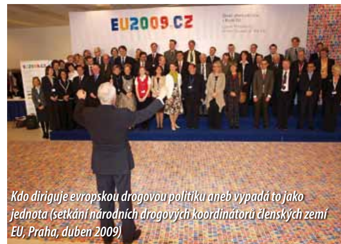
Kdo diriguje evropskou drogovou politiku aneb vypadá to jako jednota (setkání národních drogových koordinátorů členských zemí EU, Praha, duben 2009)

ale situace v EU je podstatně lepší než počátkem 90. let a je nesrovnatelná s jinými částmi světa.