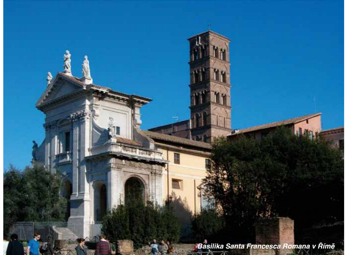
Basilika Santa Francesca Romana v Římě