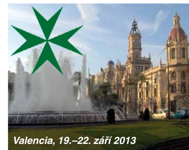
Valencia, 19.–22. září 2013