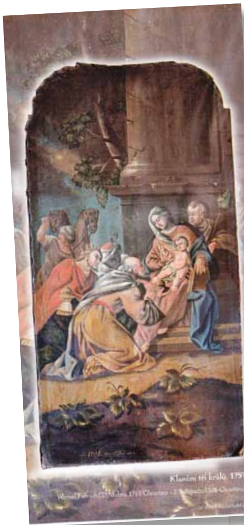
Klanění tří králů, 1757