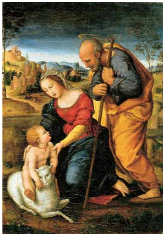
FRAFAEL: SVATÁ RODINA S BERÁNKEM (WIKIMEDIA COMMONS)

Betlémy a zase betlémy, shlédnuté ovšem s těmi, kdo nás mají rádi. Prolínání ryze českých půvabných prvků s palestinskou krajinou, přátelská setkání v kostelích o půlnoční mši a víra v to, že se stane zázrak.