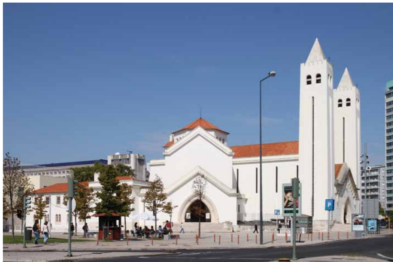
Nahoře: farní kostel svatého Jana z Boha v portugalském hlavním městě Lisabonu Dole: socha světceva tamtéž