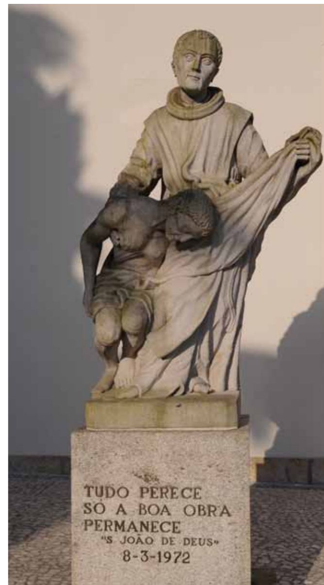
Socha svatého Jana z Boha v městečku Barcelos v Portugalsku

Tento „vpád nadpřirozena“ skončil delší hospitalizací budoucího světce v královském ústavu pro choromyslné, při níž hlubiny nevědomí vyplouvaly znovu na povrch. Životopisec uvádí, že to bylo během tohoto pobytu, kdy došlo v Janově nitru k vykrytalizování jakéhosi plánu pro následující život. Po propuštění z ústavu vykonal pouť do Guadalupe, a poté - veden zkušeností s tvrdým zacházením s nemocnými - začal sbírat peníze, oblečení a jídlo a po získání domu v něm zřídil nemocnici pro nejzavřenější a nejchudší obyvatele Granady; nad vchodem nemocnice byl umístěn nápis „Srdce ať poroučí“. S duševně nemocnými jednal s vnitřním vhledem,