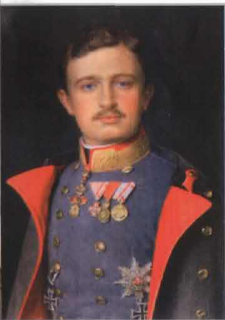
Karel I. Habsburský. Obrázek (s modlitbou) ze Staré Boleslavi.

Od roku 1974 je rytířským vzorem řádu poslední císař Rakouska-Uherska Karel I. Habsburský.